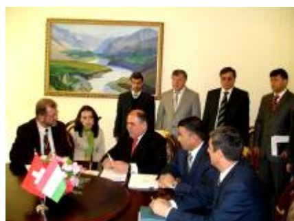
Signing of the Grant Agreement

Upon request of the GoT, the Swiss Government co-financed the ELRP with a grant of US$ 8 millions through its State Secretariat for Economic Affairs (SECO).