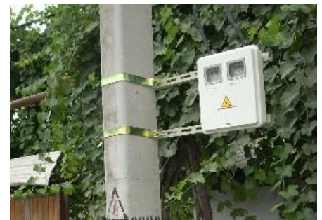
Установленный электрический счетчик

Различные компоненты проекта включают следующие: