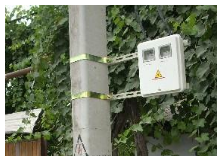
Installed electricity meter