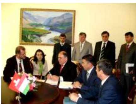
Подписание Грантового соглашения