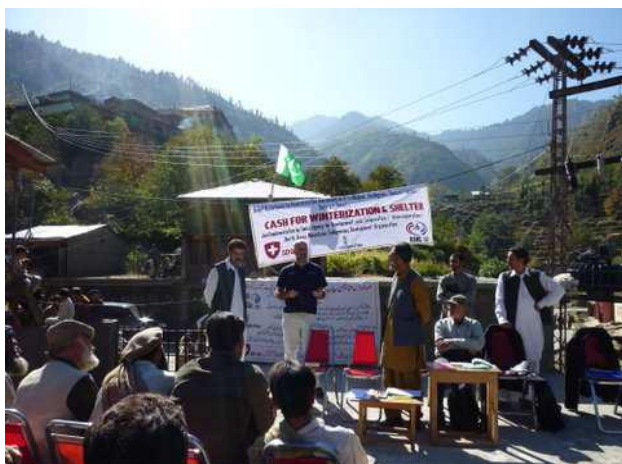
Projet de financement dans la vallée de Swat : distribution de chèques à Shinko et Bela (UC Bashigram), octobre - janvier 2010/11