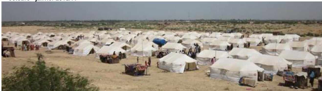
Camp de sans-abri avec des tentes de la DDC et de la Croix-Rouge suisse, Hyderabad, septembre 2010